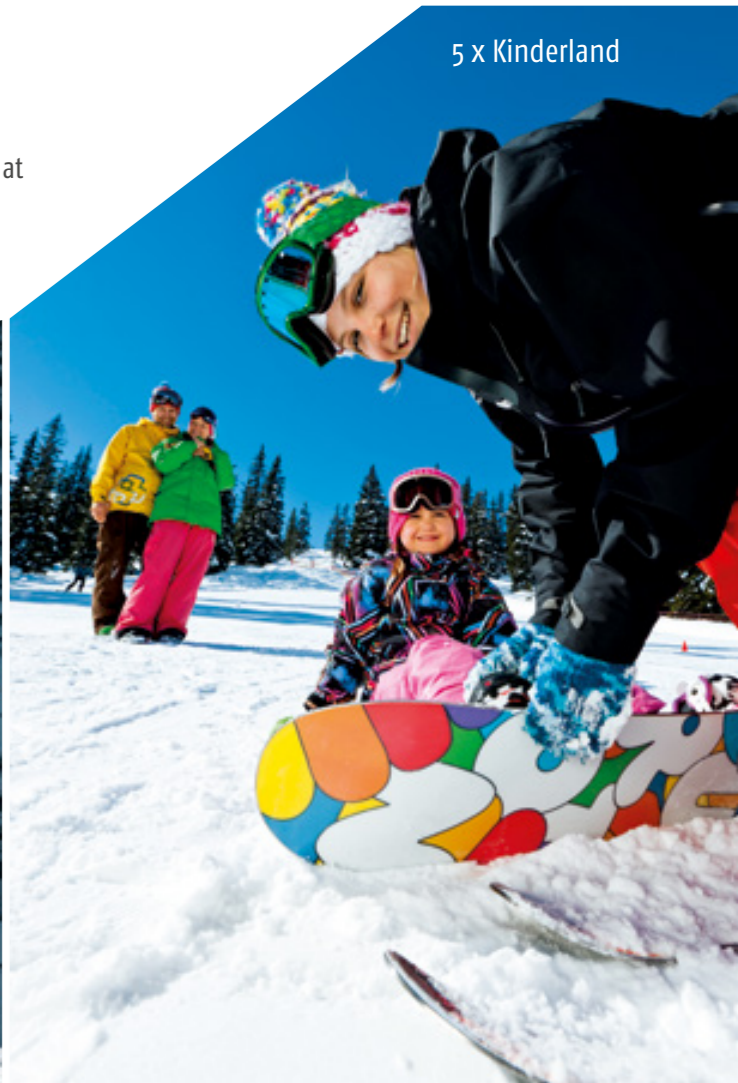
5 x Kinderland