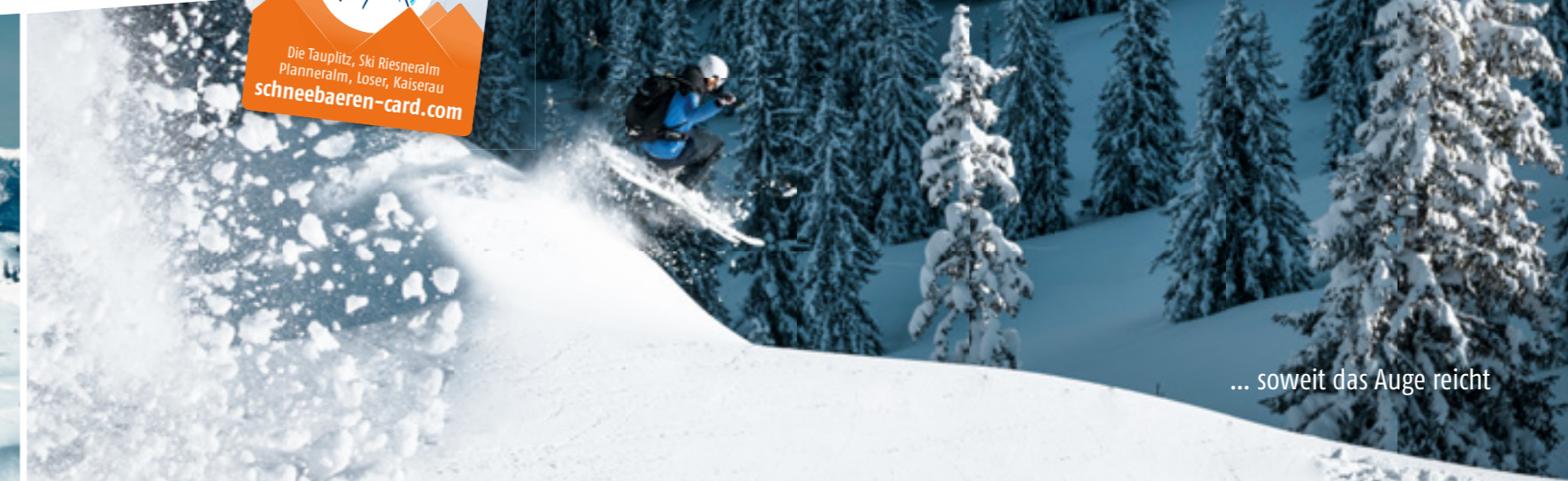
... soweit das Auge reicht

Kaiserau Tourismus GmbH Krumau 94, 8911 Admont +43 664 60353550, office@kaiserau.at facebook.com/kaiserau.tourismus www.kaiserau.at