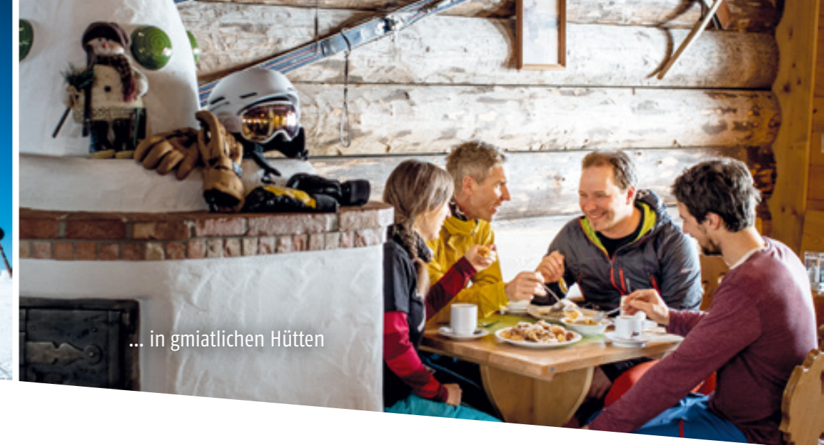
... in gemütlichen Hütten

Zur Abrundung des vielseitigen Angebotes wird auch eine Höhenlanglaufloipe über das idyllische Plateau geführt. Nach einem gelungenen Skitag lädt die großzügige Sonnenterrasse der Sportalm Kaiserau zum Verweilen bei bodenständigen Schmankerln ein.