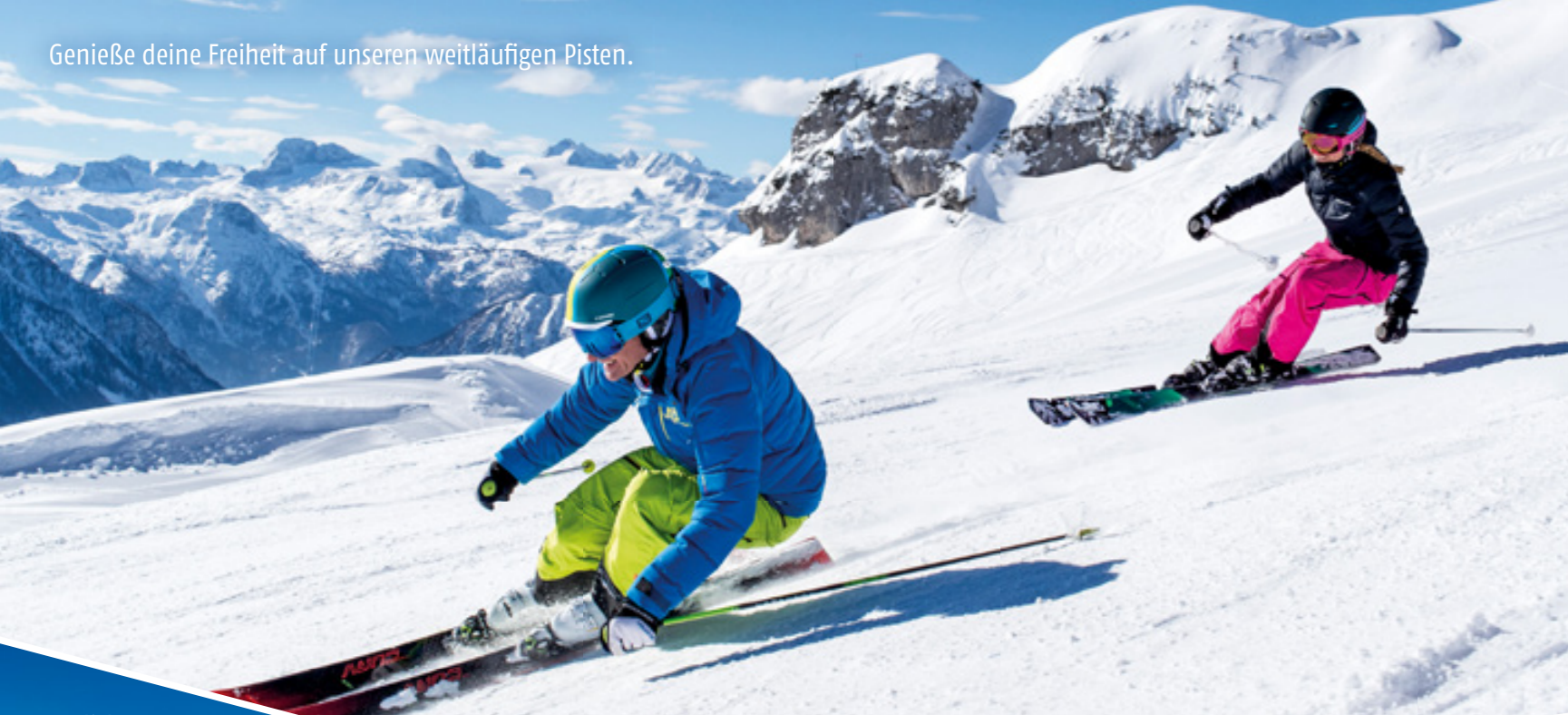
Genieße deine Freiheit auf unseren weitläufigen Pisten.