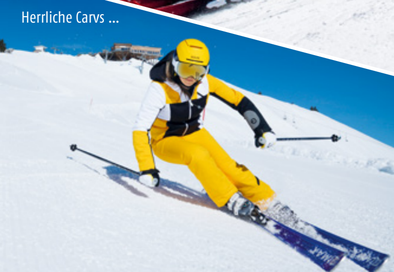
Herrliche Carvs ...