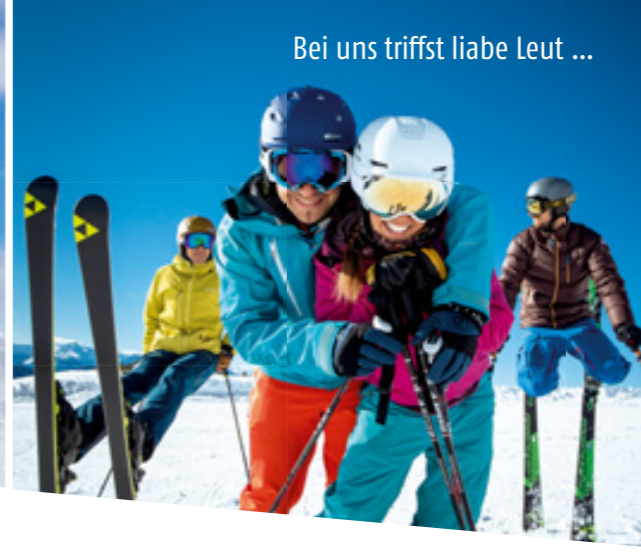
Bei uns triffst liebe Leut ...