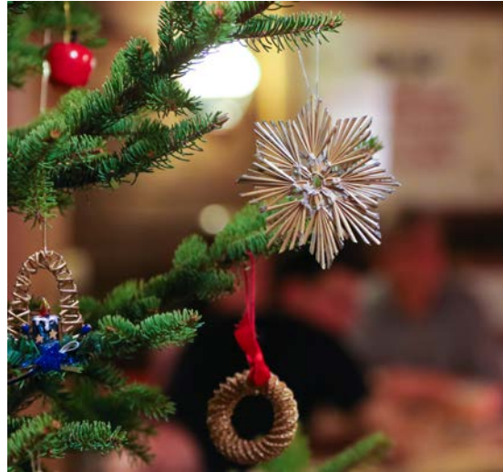
Foto Steinfisch bietet am 12. Dezember ein kostenloses Weihnachtsshooting inkl. einem 13 x 18 cm Foto Deines Kindes an. Einfach von 09:00 bis 12:00 Uhr oder 15:00 bis 18:00 Uhr mit Deinem Kind im Studio vorbeischaun und das Foto wird sofort angefertigt.