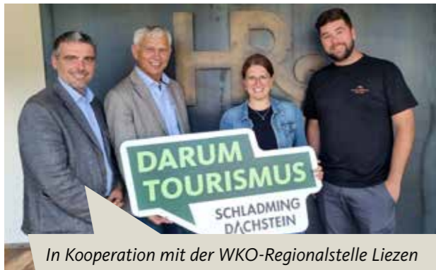
In Kooperation mit der WKO-Regionalstelle Liezen und der Raiffeisenbank Schladming-Gröbming

www.schladming-dachstein.at/darumtourismus