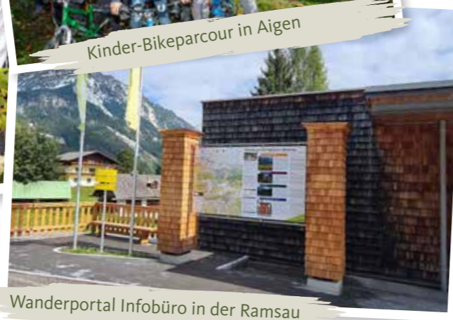
Wanderportal Infobüro in der Ramsau

Im neuen Look: An den Ortseinfahrten von Ramsau-Ort wurden die alten Info-Stelen durch neue geschindelte Info-Säulen ersetzt. Diese dienen zur Ankündigung von Events und der Präsentation touristischer Themen.