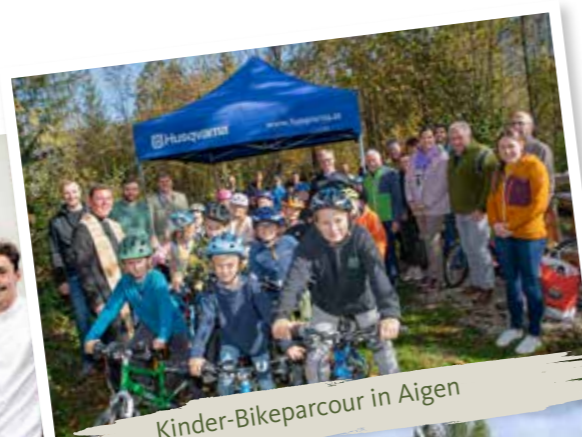
Kinder-Bikeparcour in Aigen