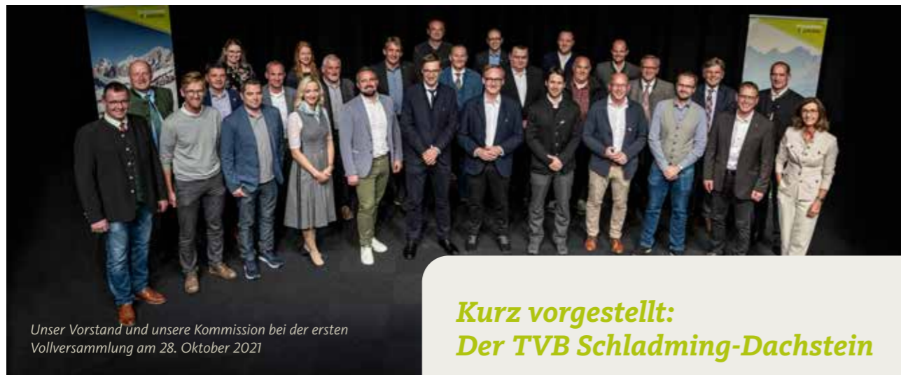
Unser Vorstand und unsere Kommission bei der ersten Vollversammlung am 28. Oktober 2021